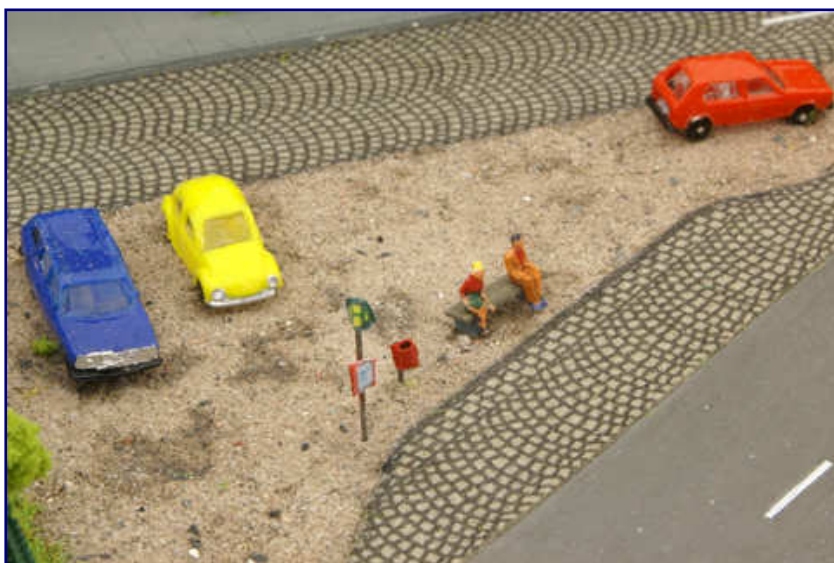
Eine der neuen Detailszenen auf dem Eckmodul von Roland Rauschenbach: Das Betriebswerk hat eine eigene Bushaltestelle. Schild mit Fahrplanaushang wie auch der Mülleimer entstanden im Eigenbau.

Bestellen lassen sich dort ohne Sorgen ums Modellbahnbudget übrigens auch Sonderanfertigungen, die nicht im veröffentlichten Angebot zu sehen sind. Dazu gehören etwa auch die Figuren für die Toilettenszene, wie sie hier vorgestellt wurde.