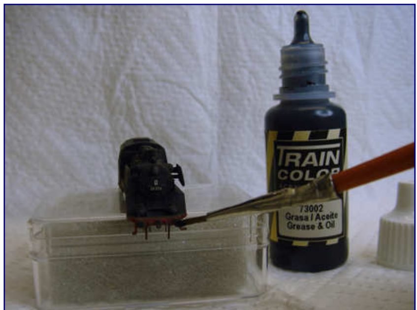
Das Fett auf den Puffertellern und an das Gestänge geschleudertes Öl im Fahrwerksbereich besitzt einen Oberflächenglanz. Im Sortiment von Traincolor ist dafür der Farbton „Fett“ enthalten. Wird er mit matten Firnis ganz oder teilweise überdeckt, lassen sich damit auch Rußspuren und Kohle nachempfinden.

Mit dem Pinsel vorsichtig verarbeitet, eignete sich der Schmutz aber bestens, um die Aufstiegsgriffstangen am Führerhaus und Tender dezent hervorzuheben. Die Stange selbst wurde vorsichtig nach dem Auftrag mit dem fast trockenen Pinsel in die Ritzen links und rechts von ihr wieder abgewischt und weitgehend freigelegt. Zuvor war mir gar nicht aufgefallen, dass diese Details am Modell nachgebildet