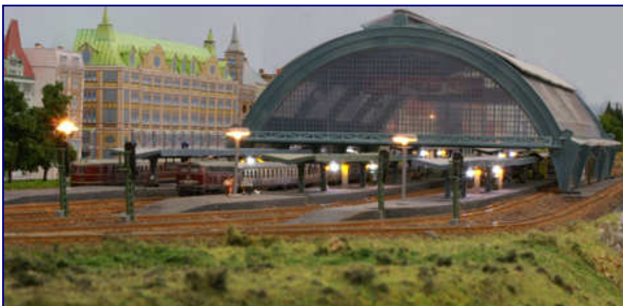
Kaum zu glauben, obwohl angesichts seiner Dimensionen naheliegend: Der Bahnhof Hudstedt von Hans-Ulrich Druske entstand aus einem Bausatz der Spur H0! Trotzdem ist auch im Maßstab 1:220 alles stimmig geworden.

Der Weg von Eutin (Schleswig-Holstein) war ihm auch dieses Mal nicht zu weit, um ein weiteres, gigantisches Modellbahnprojekt vorzuführen. Sein Bahnhof besticht durch die Anzahl und enorme Länge der Gleise samt Weichenstraßen und die Stadtgebäude in Bahnhofsnähe. Zur Vortäuschung räumlicher Tiefe werden die Einkaufsstraßen perspektivisch auf einer Hintergrundkulisse weitergeführt.