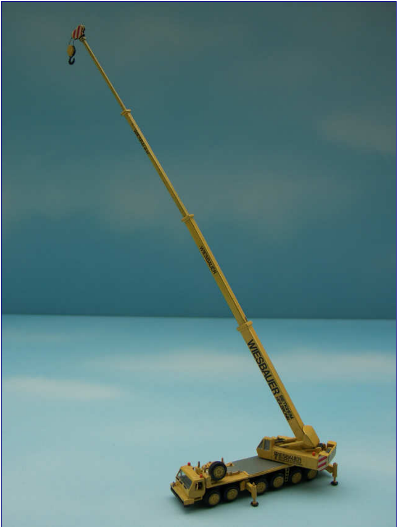
Eine beeindruckende Höhe erreicht der gesicherte Kran auch als Modell im Maßstab 1:220 schon ohne seine Gittermast-Wippspitze.