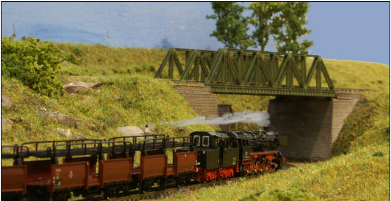
Das Kalenderdeckblatt 2008 ziert eine Baureihe 050 mit gesupertem Tender vor einer Autotransport-Leergarnitur. Die Aufnahme passte bestens zum zweiten Jahresschwerpunktthema mit Höhepunkt im Oktober, denn es handelt sich dabei um einen typischen Emslandstreckenzug bis Mitte der siebziger Jahre.

Seinen 15. Geburtstag feierten der Z Club 92 und der Stammtisch Untereschbach, letzterer genau im September. Bei bestem Wetter hat der Modellbahntreff in Göppingen stattgefunden, der nach dem Zusammenlegen mit dem Familientag und einer Verlegung hinter die Sommerferien formal in „Märklin-Tage“ umgetauft wurde.