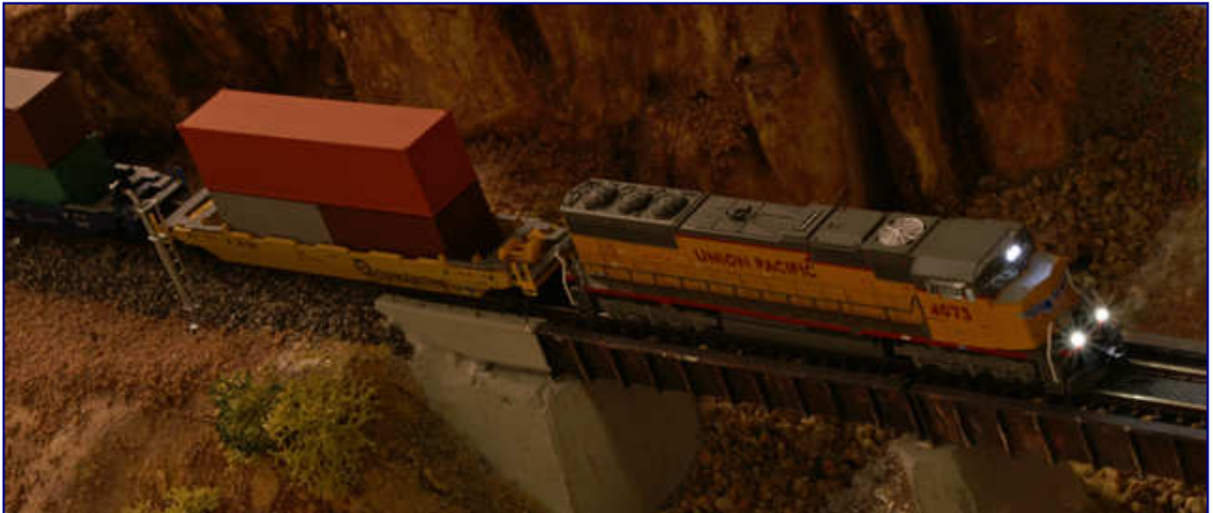
US-Vorbilder und der Digitalstandard DCC harmonieren in der Spurweite Z perfekt: So fehlten auch in Zell (Mosel) beim Adventstreffen 2007 Vorführungen verschiedener Beleuchtungseffekte nicht. Auf dem Bild zeigt eine Union-Pacific-SD70M von AZL in einer Dämmerungsaufnahme auf dem Brückenmodul von Markus Gaa, was sie so alles kann.

Fest etabliert in diesem Segment hat sich Oliver Passmann (Passmann Modellbahnzubehör), der zusammen mit Gunnar Häberer in den Kellergewölben des Zeller Rathauses viele der Beleuchtungstypen an DCC-digitalisierten Modellen vorführte.