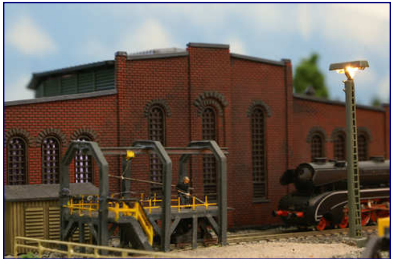
Auch das Rohrblasgerüst ist komplett im Eigenbau entstanden. Soeben rückt der „Schwarze Schwan“ 10 001 heran, der Bw-Arbeiter wartet schon.

Doch mit diesen Angaben sind erst die beiden Enden einer großen Anlage beschrieben. Hinzu kamen noch zwei Module, die eine Straßenunterführung und eine Schotterverladestation in guter Landschaftsgestaltung zeigten. Bestimmendes Element war der große „Bahnhof Hudstedt“ von Hans-Ulrich Druske, der sich damit ein Mal mehr als Koryphäe des Modellbaus erwies.