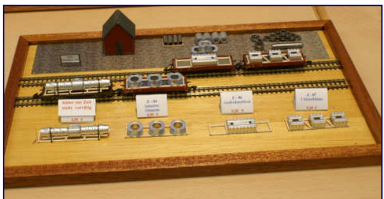
Eine Auswahl der vorgestellten Küpper-Neuheiten v.l.n.r.: Pumpengehäuse (Art.-Nr. Z-81), Industrieelemente (Z-84) und Motorblöcke (Z-86 und Z-87).