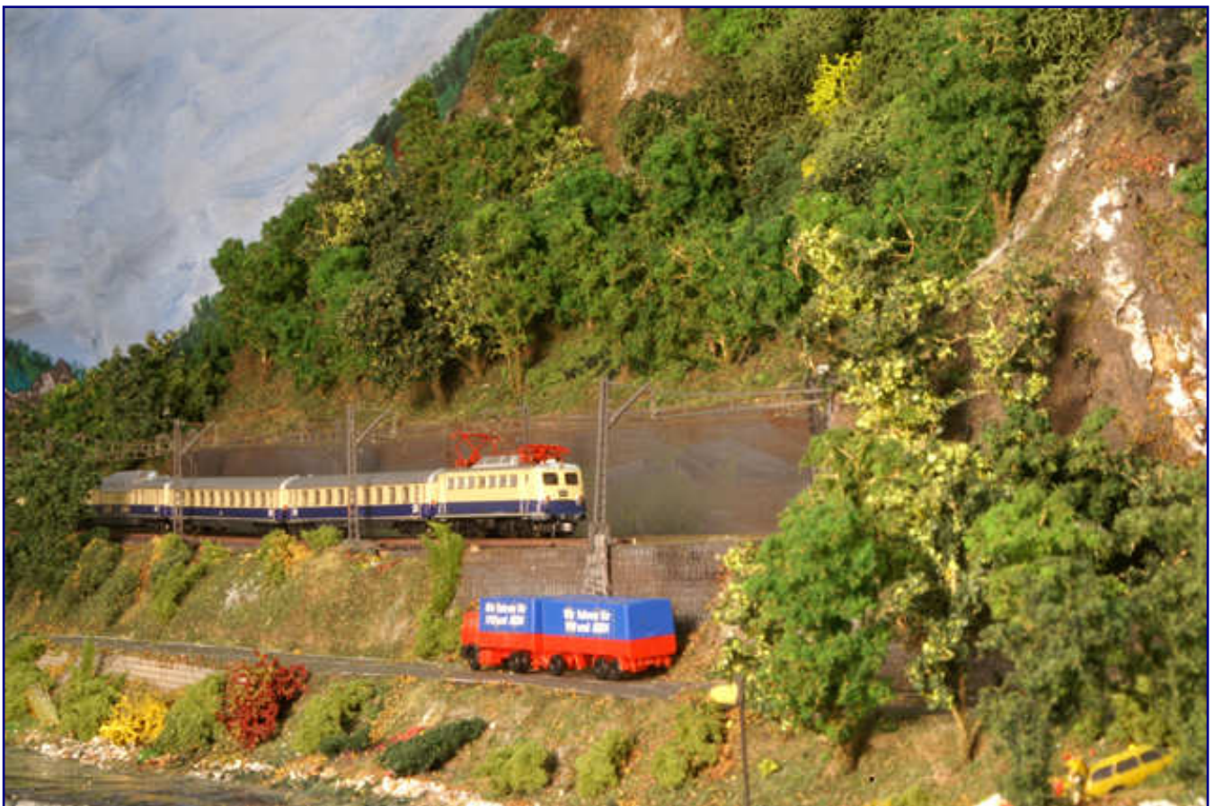
Ein Motiv, das bestens zum ausgeklungenen Jahresschwerpunktthema passt: Der FD Rheingold fährt im Jahr 1962 in den Loreleytunnel ein – zumindest auf einem Modul von Hans-Georg Kunz.

zeigten zum Jahresausklang auch noch mal ihre Neuheiten. Bei Küpper neu im Angebot sind folgende Ladegüter für die Märklin-Modelle 8610 und 8622: Messingschrott (Z-14-M), Kupferschrott (Z-76),