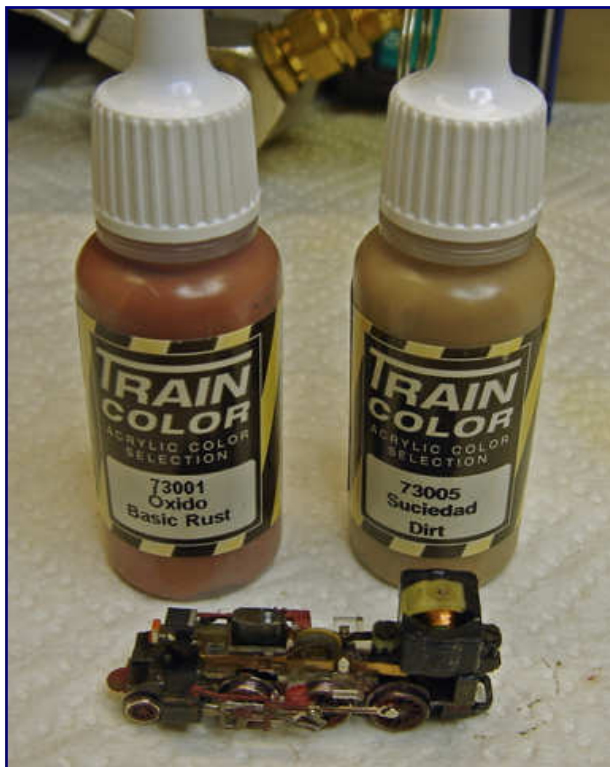
Nach dem Auftrag von Grundbraun auf das Fahrwerk werden gezielt Schmutz und Grundrost mit dem Sprühstrahl aufgetragen. Sie sorgen für das typische, verschmutzte Fahrwerk einer Dampflok.

Wichtig für jede Alterung ist aber die vorherige Vorbildstudie zu typischen Verschmutzungsarten und –erscheinungsbildern.