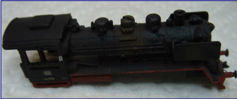
Schon nach den ersten Arbeitsgängen sind Betriebsspuren deutlich sichtbar, hier vor allem am Sanddom, aber auch am Windleitblech oder Führerhaus.

Rostbraun ist die erste Farbe, die auch mit dem Pinsel verarbeitet wird. Nur mit einem Hauch Farbe auf der Pinselspitze, kurz auf dem Küchenpapiertuch abgestrichen, fahre ich vorsichtig über alle Nietensbahnen des Tenders („Drybrush-Technik“). Da er in der letzten Ausgabe bereits eine Echtkohleeinlage erhalten hat, bestünde mit dem Luftpinsel ein Restrisiko, diese versehentlich zu benebeln.