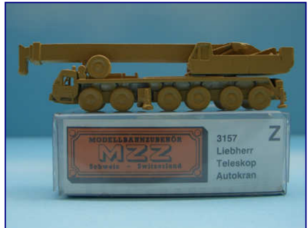
Das MZZ-Modell 3157 eines Liebherr-Teleskop-Autokrans konnte Alfred Geifes nicht überzeugen. So sann er auf Abhilfe und wagte einen umfangreichen Umbau.

Vorbild ist der Teleskop-Autokran Liebherr LT1120. Er ist für eine Traglast von 120 t ausgelegt, hat eine max. Hubhöhe von 60 m und seine Reichweite beträgt 42 m. Sein Fahrmotor leistet 430 PS (310 kW), der Kranmotor 185 PS (136 kW). Die Bilder des Krans in Aktion sahen wahrhaft beeindruckend aus. Und dann kam der entscheidende Anstoß für mich: Ich sah den Kran mit eigenen Augen auf einer Baustelle in Aktion - gewaltig so ein Teil. Seine unwahrscheinlich vielen beweglichen und verstellbaren Möglichkeiten. Das müsste man ins Modell umsetzen!