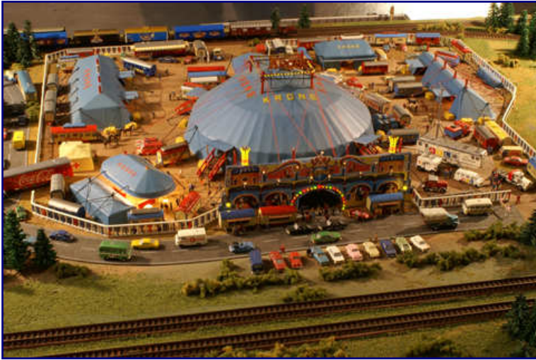
Die Z-Freunde Saarpfalz zeigten mit liebevoller Gestaltung und zahlreichen Details versehen unter anderem den Zirkus Krone auf ihrer Spur-Z-Anlage.

auch noch funktionstüchtig. Damit konnte er zeigen, was ihm beim Vorbild daheim immer noch verwehrt ist.