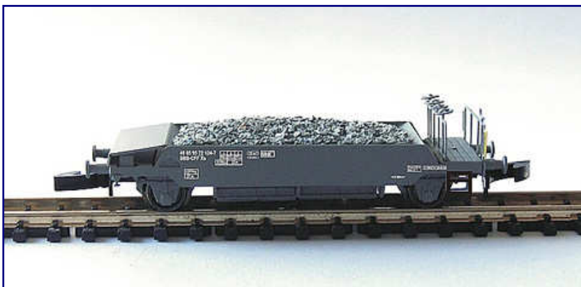
Der Neuschotterwagen Xs72 der SBB von Freudenreich Feinwerktechnik glänzt mit feinsten Detailnachbildungen.