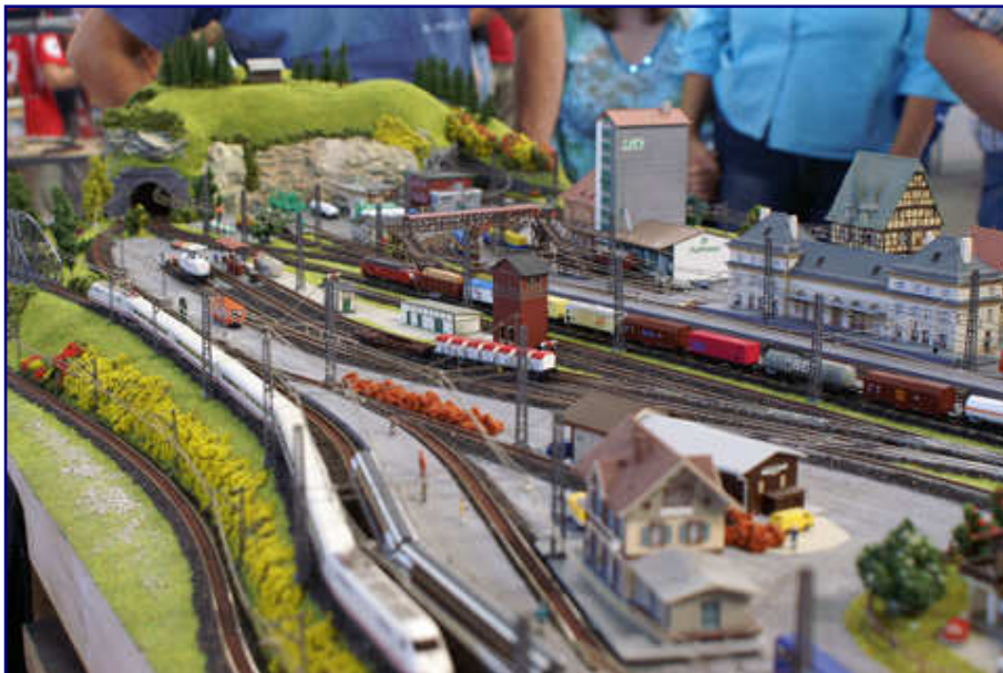
Zu den wenigen Exponaten in der Spurweite Z gehörte diese Anlage des Modellbahn-Stammtisches Stuttgart, auf der moderner Schienen- und Straßenverkehr gezeigt wurde. So befindet sich der IC-Experimental (Baureihe 410) gerade auf einer Testfahrt.

Wieder draußen, widmeten wir uns noch den Vorbildmaschinen. Ließ die zu Führerstandsmittfahrten einladende 01 5 der ÖGEG vor allem die Herzen der DR-Freunde höher schlagen, fanden Anhänger der DB Vergleichbares in der 01 1081. Lokomotiven der Baureihen V 60, 103, 182 (Taurus), ein deutsches Krokodil E 94 und die 01 066 rundeten das klassische Märklin-Programm im Vorbild ab.