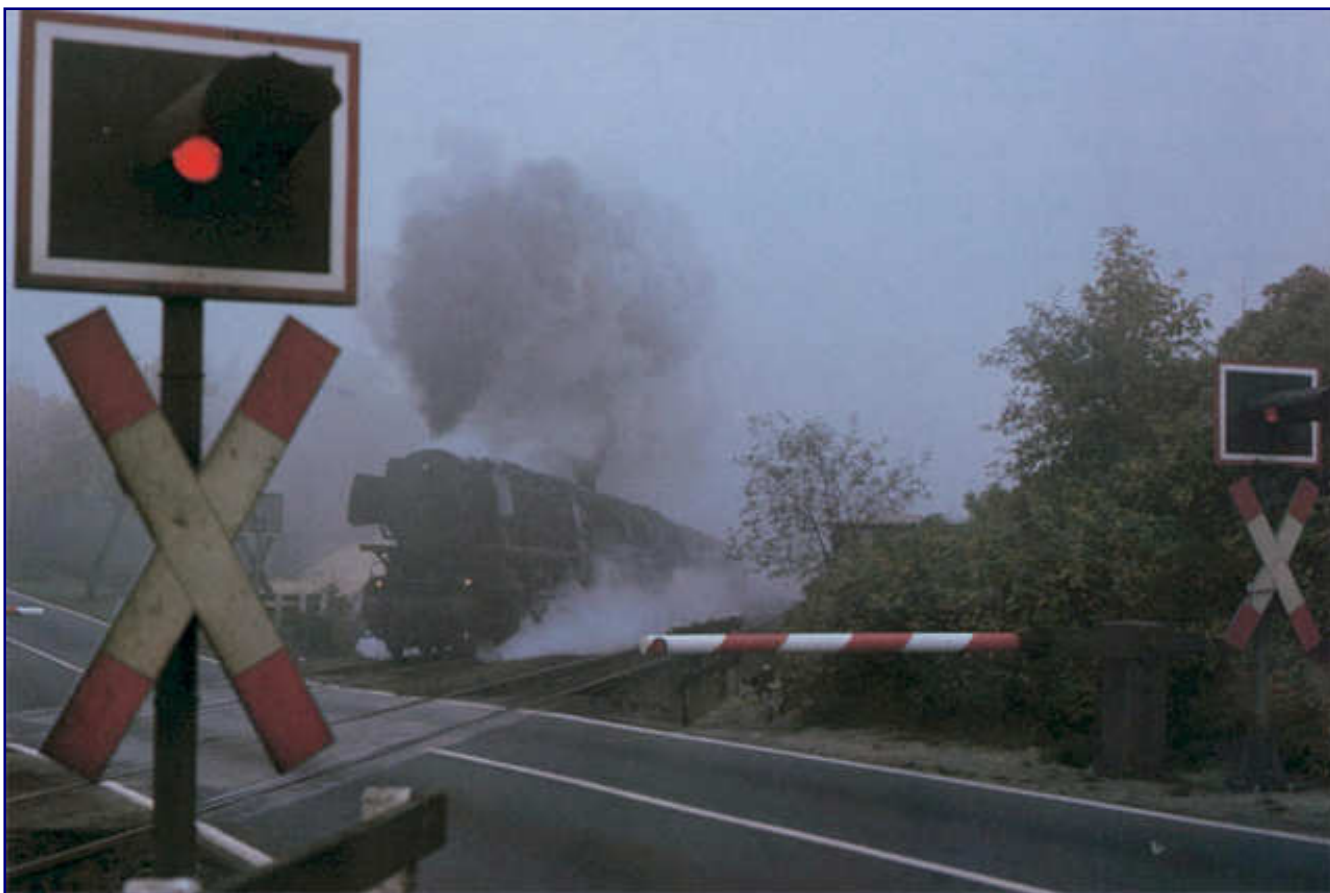
Das ersehnte Traumfoto: 043 087-6 und 043 321-9 tauchen am Blinklicht-Bahnübergang südlich von Lathen mit einem „Langen Heinrich“ aus dem Nebel auf.

Emslandstrecke. Doch selbst die ehemalige DB-Paradelok mit dem markanten „V“ auf der Haube, die noch die Erinnerung an das deutsche Wirtschaftswunder wach hielt, war uns Dampf Freunden in diesen