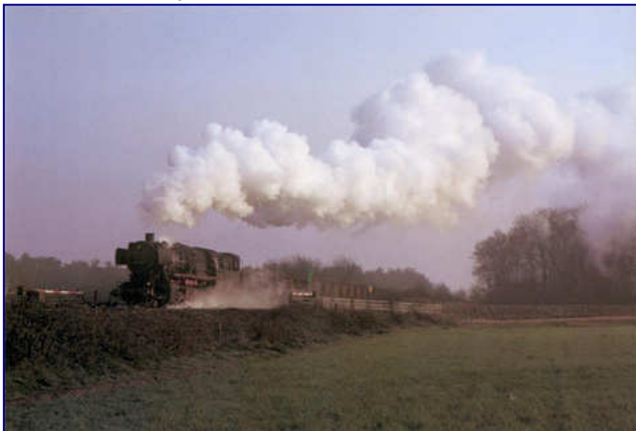
Bei Lokmangel waren auch Loks der Baureihe 50 noch lange vor leichten Güterzügen auf der Emslandstrecke zu sehen. 052 188-0 stößt eine lange, weiße Dampffahne in den frühen Morgenhimmel, als sie mit einem Leerpark Autotransportwagen kurz vor Lingen fotografiert wird.

Emslandstrecke. Doch selbst die ehemalige DB-Paradelok mit dem markanten „V“ auf der Haube, die noch die Erinnerung an das deutsche Wirtschaftswunder wach hielt, war uns Dampf Freunden in diesen