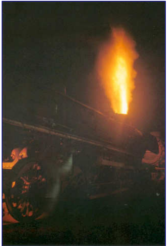
Eine lange Flamme schießt über 042 360-8 in den Himmel, als nach dem Abstellen der Brenner die Leitungen ausgeblasen werden – ein beliebtes Fotomotiv bei Dampffreunden.

Kantige, alte Elektrolokomotiven, die längst keinen technischen Fortschritt mehr verkörperten und die runde, rote V 200 waren nach dem Ende der Dampfära noch für einige Jahre der Alltag auf der