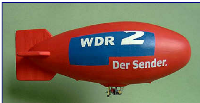
Zwei Beispiele für gelungene Leserarbeiten - die Entdeckung der Luft im Maßstab 1:220.