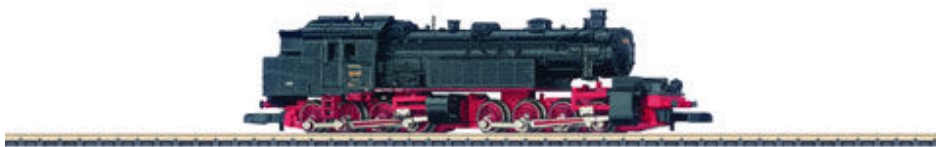
Baureihe 96 der Deutschen Reichsbahn. Epoche 2 (Art.-Nr. 88291).

Klasse statt Masse bestimmt die Neuheitenauswahl im Modelljahr 2006. Auffallend knapp ist allerdings trotzdem die Auswahl an Wagenmodellen – Formneuheiten sind da Fehlangeige. Selbst die Insider müssen sich mit einem altbekanntem Stück (Grundmodell 8600) begnügen, das als Migros-Ausführung von Interfrigo, eingestellt bei der SBB in Epoche 3, kommt (Art.-Nr. 80316). Wer einen Kühlwagen-Ganzzug zusammenstellen möchte, dürfte sich darüber aber sicher freuen.