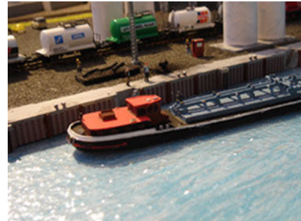
Beispiel für ein gesuchtes Fotomotiv. Die Verknüpfung mit der Bahn sollte so eng wie möglich sein.