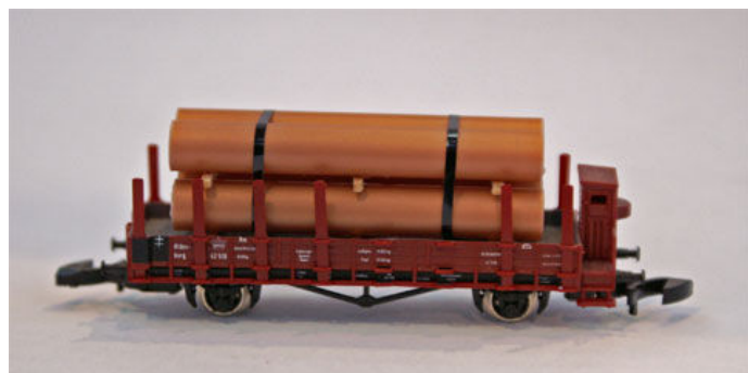
Ladegut „Kupferröhren“ von Heico (Art.-Nrn. 22508 und 22509).

Von Heico dürfen wir ganze 10 neue Ladegüter erwarten, deren