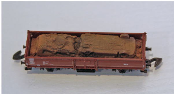
„Autoschrott“ von Ladegüter Bauer, Art.-Nr. Z0001