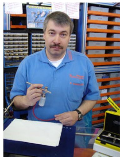
Vorführungspremiere auf der Intermodellbau 2005 in Dortmund.

Die innovative Idee der Evolution steckt aber am Ende des